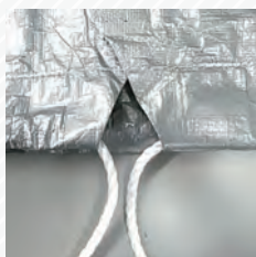
表側・裾絞りロープ