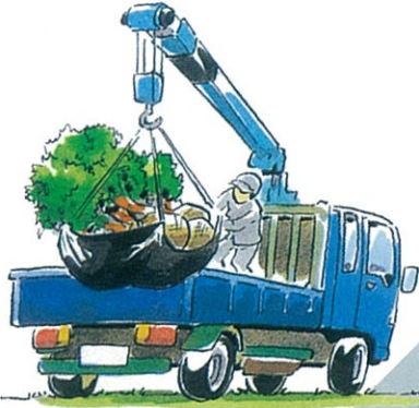
造園での運搬や土木作業に