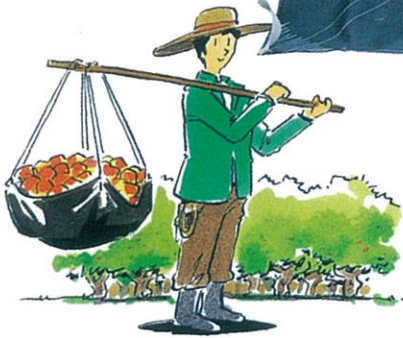
農産青果物の運搬作業に