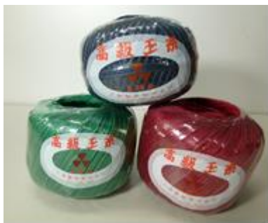
■製品写真：高級玉糸

百貨店によって赤、緑、茶色、水色と色分けし、人気の商品となりました。今では赤・青・緑3色になり、天然繊維でちょっと荒削りな独特の風合いや色などの素材感からクラフトなどにも使われています。